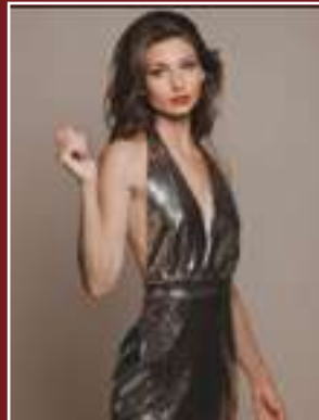
Kırmızı Halı Röportajları Hayat MERTCAN