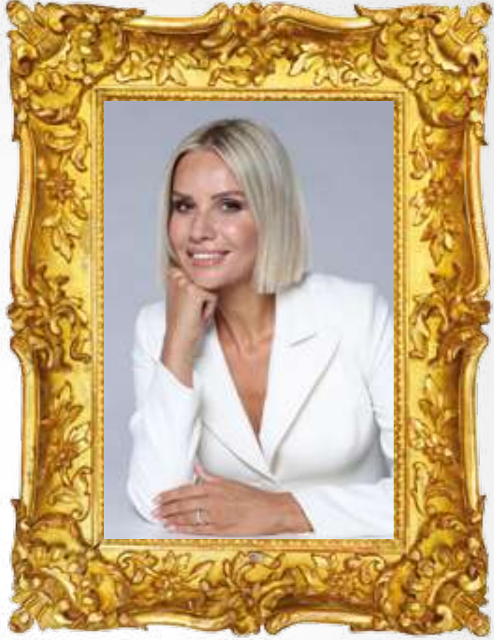
ESRA EROL'DA

E sra Erol'da, 31 Ağustos 2015 tarihinden itibaren hafta içi her gün[1] atv'de yayımlanan reality türündeki televizyon programında birbirinden ilginç konuları ele alıp Konuklarını ağırlayan Başarılı Programdır. Programında Engelli vatandaşlara desteğini hiç esirgemeyip mavi kapak kampanyasıyla 1000'in üstünde akülü sandalye dağıttı.